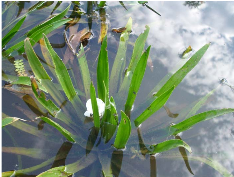
Slika 15: Vodna škarjica (V. R.)

Vodna škarjica je delno potopljena trajnica. Na dno je pritrjena s tankimi, dolgimi koreninami. Tvori plavajoče listne rozete, ki imajo premer do 30 cm. Listi so suličasti, podobni listom aloje in imajo na robovih ostre zobce. Cveti od maja do julija. Cvetično steblo ima pod vrhom "škarjasta" ovršna lista. Cvetovi so beli, velikosti od 2,5 do 3 cm.