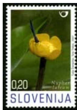
Slika 13: Rumeni blatnik na poštni znamki