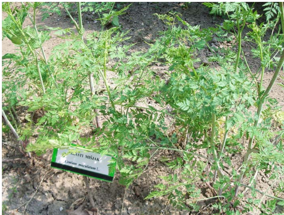
Slika 10: Pikasti mišjak (V. R.)

Če rastlino zmečkamo, se od nje širi dolgo obstojen, intenziven vonj, ki je izrazito neprijeten. Na spodnjem delu rastline lahko opazimo temno rdeče do rjave pike, po katerih je dobil del imena.