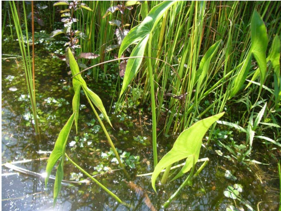
Slika 9: Navadna streluša (V. R.)

Lahko doseže do 80 cm višine, če so ugodni pogoji. Ima tri vrste listov (podvodne, plavajoče in nadvodne). Posebno zanimivi so nadvodni puščičasti/kopjasti listi, ki so dolgi do 20 cm, na sušnejših rastiščih pa so listi ozki in suličasti. Cveti od junija do konca avgusta. Cvetovi so beli z vijoličastimi prašniki. Jeseni napravi gomoljaste tvorbe — pačebulice, ki prezimijo v blatu. Z njimi se prehranjujejo divje race.