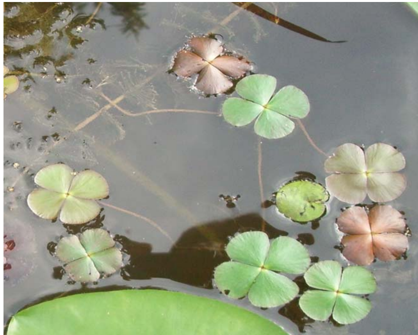
Slika 14: Štiriperesna marzilija (V. R.)

Pri tej praprotnici so trosovniki v posebnih tvorbah, sporokarpnih (preobraženi listni roglji), ki so pri dnu listnih pecljev. V vsakem sporokarpu je po več trosišč, v vsakem trosišču so skupaj moški in ženski trosovniki.