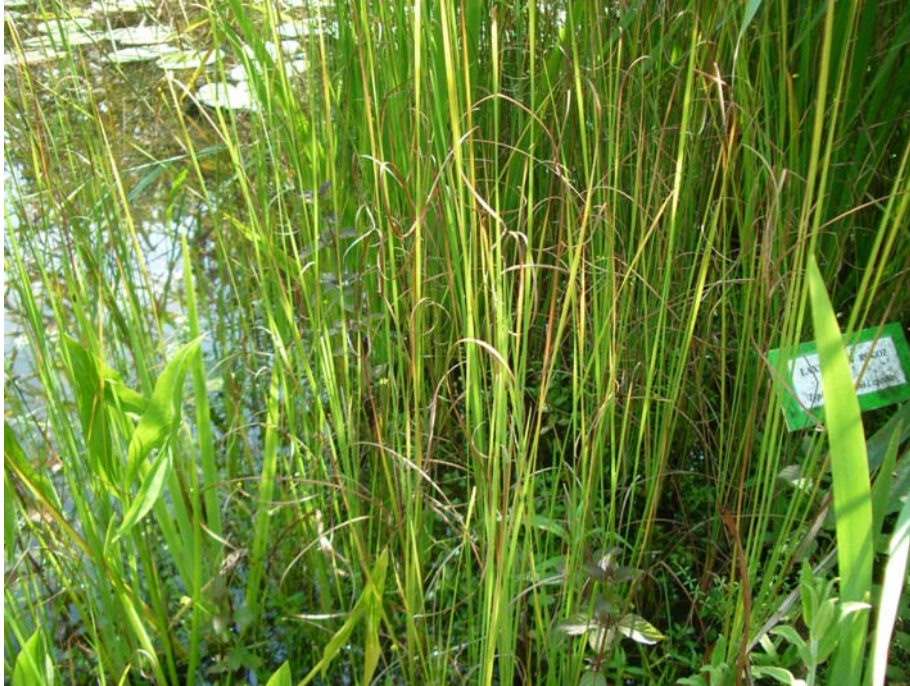
Slika 4: Laxmannov rogoz, vmes navadna streliša (V. R.)

Ozkolistni ima moški in ženski del socvetja približno enako dolg, vsak 10—35 cm, pri laxmannovem pa je moški del 2—4 x daljši od ženskega, ki je svetlo rjave barve in dolg do 7 cm. Listi pri obeh vrstah so široki do 7 mm.