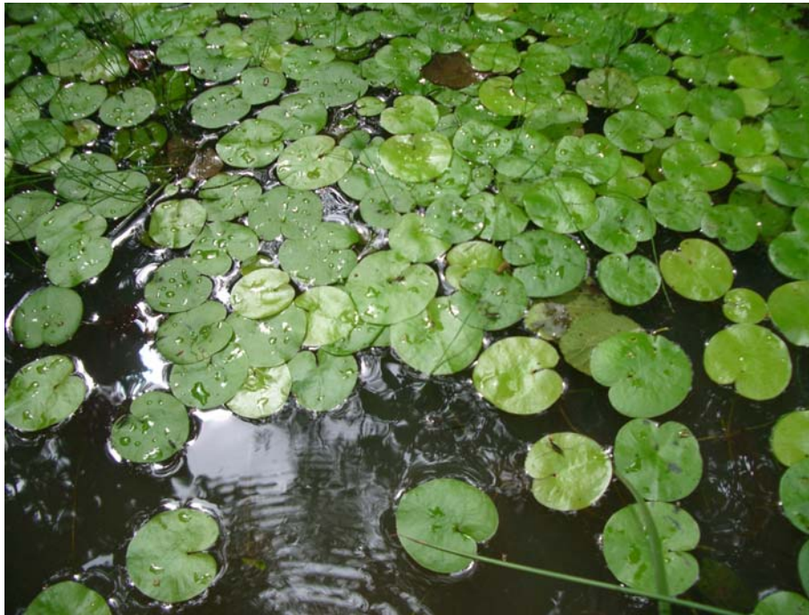
Slika 18: Žabji šejek (V. R.)