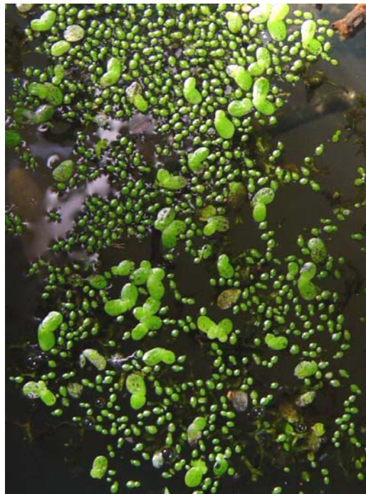
Slika 5: Mala vodna lečica, vmes navadna vodna leča (Marjan Šenica)

Navadna vodna lečica plava na površini vode in nima korenin. Cvetovi so dvospolni. V zanjo ugodnih razmerah je zelena vse leto, vse leto cveti in vse leto semena dozorevajo. V naših razmerah popki pozno jeseni potonejo na dno in se spomladi ponovno dvignejo na površje.