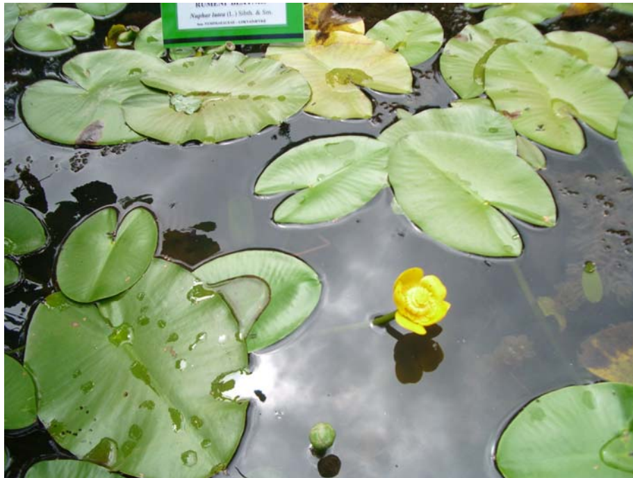
Slika12: Rumeni blatnik (V. R.)

kroglasto-ovalne, na dnu srčasto oblikovane. Zgornja površina je povoskana, kar preprečuje omočenje. V plavajočih listih je dobro razvito stebričasto in gobasto tkivo. Na spodnji strani listov so glavičaste sluzne žleze. Cveti od junija do septembra. Rumeni cvetovi so posamični, dolgopecljati in poženejo nad vodno gladino. Odprti cvetovi imajo do 5 cm premera. Rumelih čašnih listov je pet, 13 rumenih venčnih listov je spremenjenih v manjše medovnike. To so žleze, ki izločajo in hranijo medičino, ki je zanimiva za opraševalce. Plod je zelena jagoda.