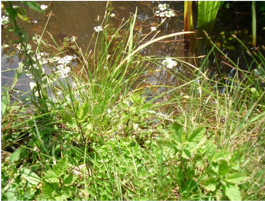
Slika 3: Kranjska sita (V. R.)