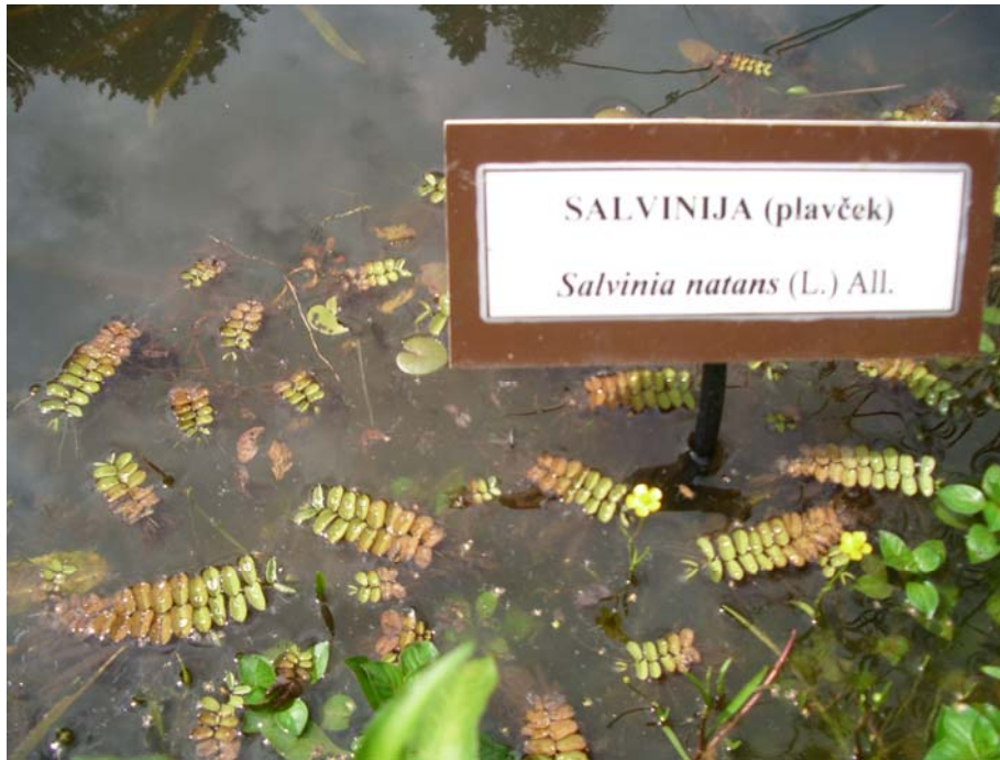
Slika 11: Plavček (V. R.)