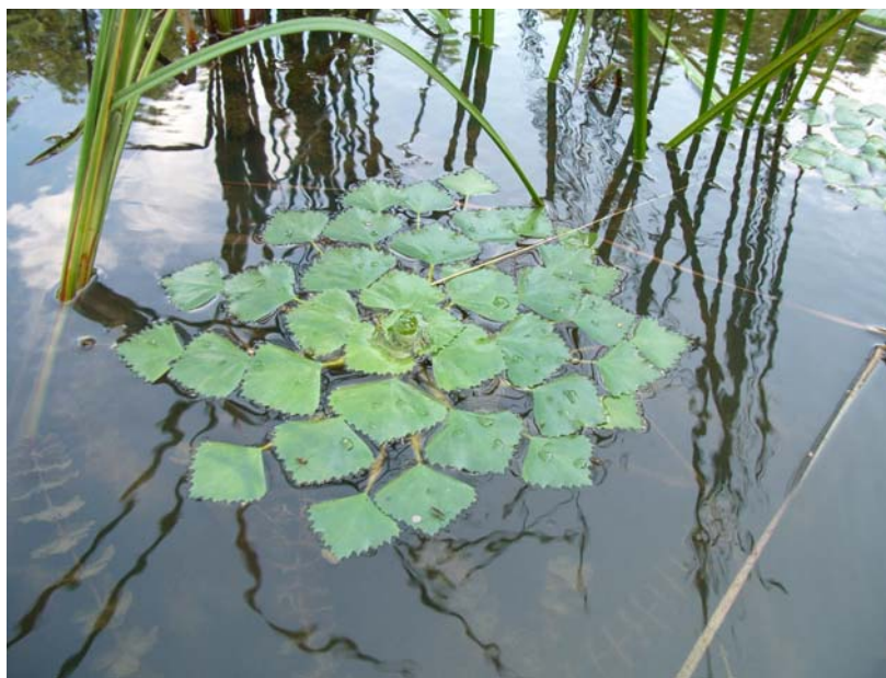
Slika 16: Vodni orešek (V. R.)

Vodni orešek je enoletna vodna rastlina s tankim, dolgim stebлом, ki se vsako leto znova zaseje sama. Nima prave korenine, pomožne korenine na bazi stebela pritrjujejo rastlino v blatna tla, trakasti listi, ki izraščajo višje, pa so zelene barve in namenjeni fotosintezi. Listi, ki se razvijejo nad vodno površino, so rombaste oblike z nazobčanim robom in rozetasto razporejeni, kar daje rastlini atraktiven videz. Listi preko poletja pordečijo. Njihovi peclji so mehurjasto napihnjene in plavajo na vodi. Beli cvetovi so zvezdaste oblike. Plod je svetlo rjav oreh nepravilne oblike, ki ima štiri rogate izrastke, trdo lupino in eno samo veliko belo seme. Ko orešek dozori, pade na dno in iz njega se razvije nova rastlina. Raznašajo ga vodne ptice.