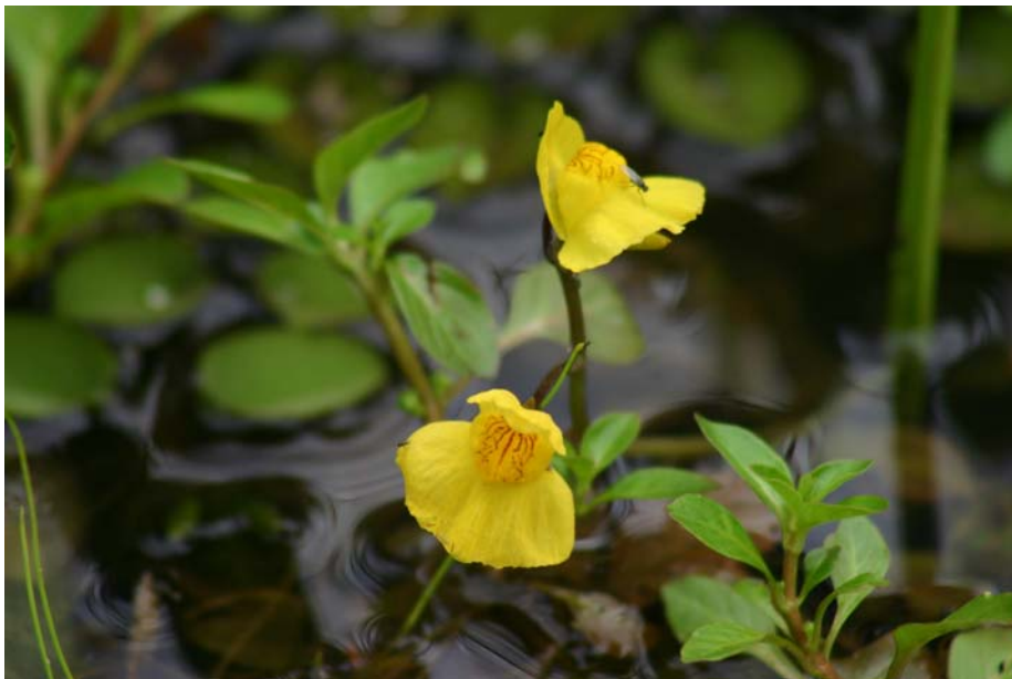
Slika 8: Cvet navadne mešinke (Roman Hergan)