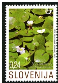
Slika 17: Žabji šejek na poštni znamki

Stebła žabjega šejka plavajo na vodni površini in so obdana s tri do pet majhnimi, lokvanjem podobnimi listi. Iz stebel poženejo dolge korenine. Če rastlina priplava do obale, se hitro ukorenini. Pritrjuje se v mulju, listi srčasto-ledvičaste oblike so na vodni gladini. Nad vodo požene tudi bele cvetove, ki so v premeru veliki le do 2 centimetra. Od šestih cvetnih listov so trije zunanji zeleni, trije notranji pa beli, pri dnu rahlo rumenkasti. Žabji šejek je dvodomna rastlina. Plodovi so večsemenske jagode, ki odpadejo in se potopijo na dno, kjer prezimijo. Stara rastlina odmre. Spomladi se jagode dvignejo na površje in poženejo nove rastline. Dvig jagod je odvisen od spomladanskih temperatur. Če je pomlad hladna, se dvignejo kasneje.