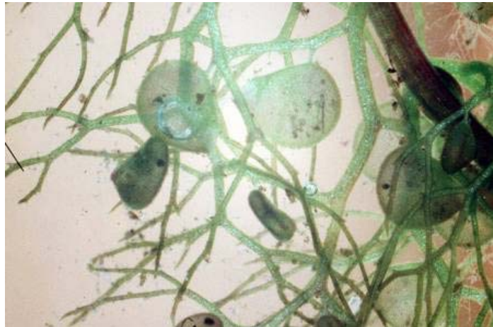
Slika 7: Mešički za lovljenje žuželk