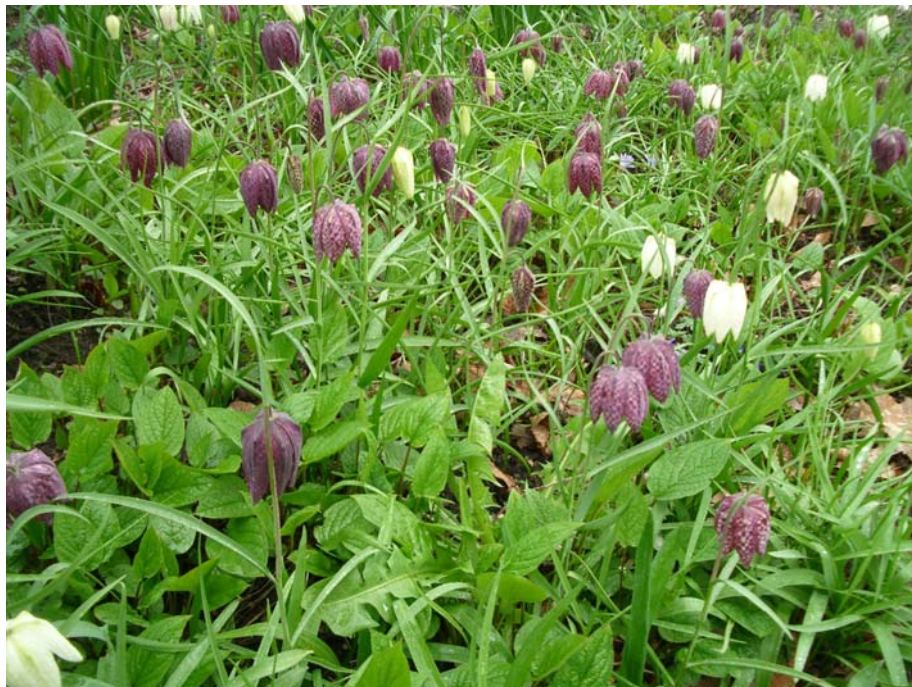
Slika 6: Močvirska logarica (V. R.)

Na vrhu poganjka zraste en (redko dva) zvonast, kimast cvet. Barva cveta je navadno rdeče rjava s svetlimi lisami, če imamo srečo, pa lahko naletimo tudi na bel primerek ali bel z rdečimi robovi.