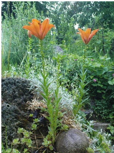
Brstična lilija- Lilium bulbiferum