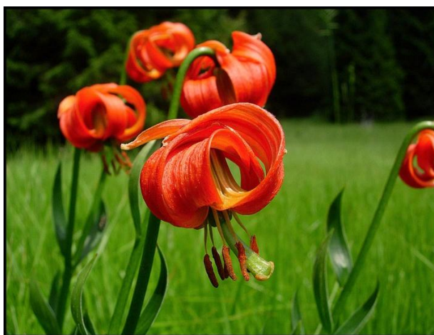
Kranjska lilija- Lilium carnolicum