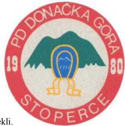
Slika 3: Grb PD Donačka gora Stoperce