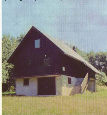
Slika 17: Gozdarska kočica ob gozdu Bukovjek

Tam kjer je danes Gozdarska kočica, je bila pred dobrimi tridesetimi leti le še kmetija. Pogosti nočni obiski divjih svinj, ki so predčasno pospravljale pridelke, samota in dolga pot do doline so ljudi pregnali v bolj obljudene kraje.