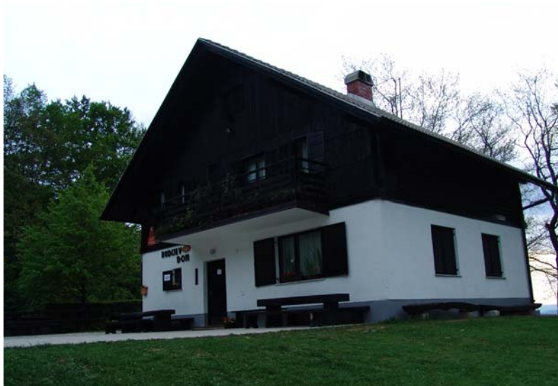
Slika 11: Pogled na Rudijev dom z jase pod domom

Do Rudijevega doma je možno priti po več poteh. Če smo vestni pohodniki se torej najraje odpravimo peš. Lahko gremo čez zaselek Travnji potok pri Stopercah in nato skozi Čermožiše. Ena izmed variant je tudi ta ki nam jo pokaže SPP, se pravi na vrhu Stare grabe levo in po pešpoti. Pa še več pešpoti bi se našlo. Najhitreje pa smo verjetno tam, če se odpravimo z avtomobilom kar direktno čez zaselek Tlake, po asfaltni cesti. Cesta je asfaltirana skoraj v celoti.