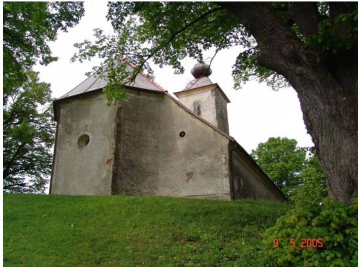
Slika 9: Cerkev na Ložnem od zadaj