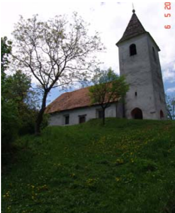
Slika 4: Cerkev sv. Ane

Torej kot sem že omenil v opisu poti, po slabi uri hoje prispemo do prve vmesne točke pohoda. To je cerkev sv. Ane. Najprej je potrebno iti mimo zapuščene mežnarije, nato pa le pridete do cerkve.