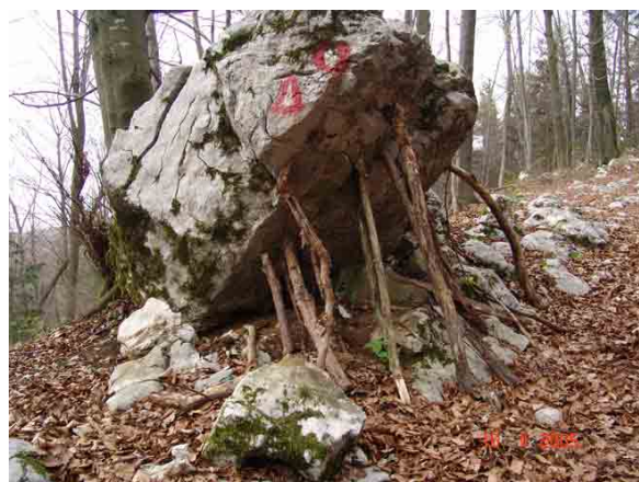
Slika 15: Zanimiv prizor na poti proti vrhu Donačke gore