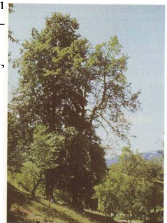
Slika 18: Še ena znamenitost na poti - skorš

Po počitku pri Gozdarski hiši se začnete počasi spuščati v dolino. Na poti do nje pa se srečate še z mogočno lipo, ob lipi pa je še ena znamenitost – skorš; drevo z drobnimi rumenimi, hruški podobnimi sadeži, trpkega okusa. Vsaj nekaj na vsej poti, kar je pod okriljem spomeniškega varstva, saj je to eden izmed najstarejših in tudi najdebelejših (premer debla je 52 cm) skoršev v Sloveniji. Obenem pa je to drevo tudi zelo redko, zato je vredno ogleda.