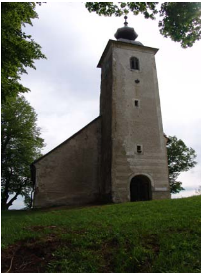
Slika 8: Cerkev na Ložnem