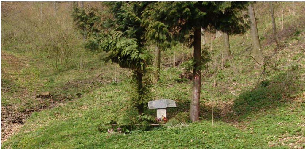
Slika 7: Spomenik padlim kurirjem v Sučju

Na poti do Ložnega pa srečate tudi spomenik padlim kurirjem v Sučju. V tihoti gozda, ki jo včasih zmoti ubrano petje ptic, oddaljeni šum vetra ali zateglo krakanje vrane, so februarja 1945 med bukvami izkrevaveli tisti, ki so v nemirnih vojnih letih komaj začeli živeti, preživeli štiri leta vojne in tri mesece pred koncem pokopali svoje sanje.