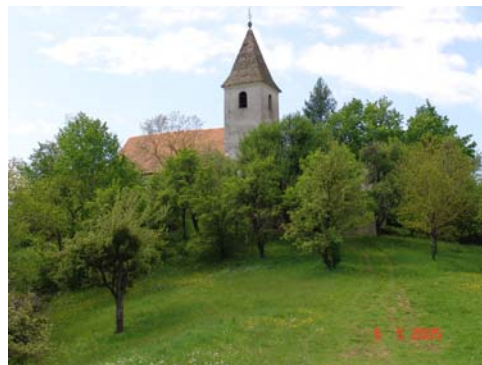
Slika 5: Turn sv. Ane iz daljave

Cerkev sv. Ane je bila zgrajena okrog leta 1300, vendar je bila tolikokrat prezidana, da je od prvotne gotске stavbe ostal le prezbitერიj z gotskimi okni. Sv. Ana je zavetnica mater. K njej pa se zatekajo tudi ženske, ki bi želele imeti otroke. Zato v ta namen pred vhodom v cerkev na stropu visi vrv, privezana na zvon, ki bi jo naj ženske potegnile in si zaželele otrok. Tega božjega blagoslova je bilo v preteklosti v teh krajih kar precej.