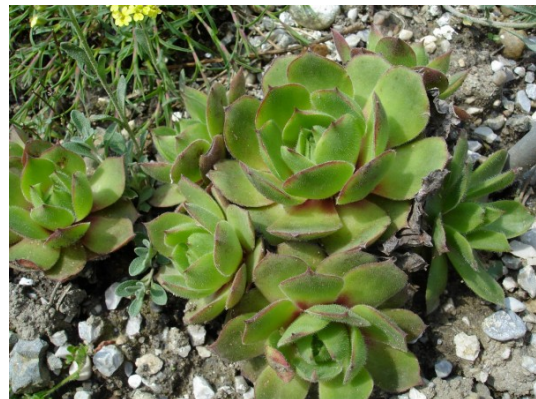
Slika 16: Juvanov netresk na Donački gori

Mesnati listi služijo kot rezervoar za vodo in tako uspeva preživeti v z vodo zelo revnem okolju podobno kot bolj znani kaktusi.