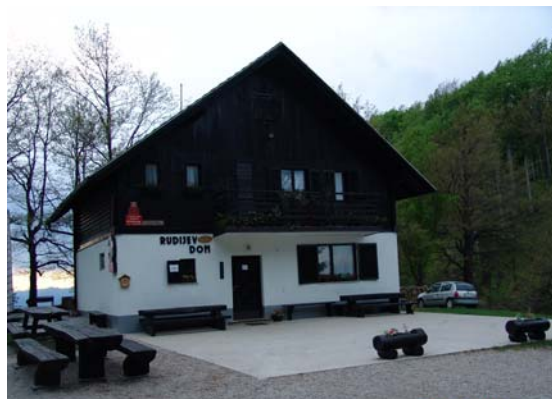
Slika 10: Rudijev dom pod Donačko goro

V domu je tudi možnost prenočitve, saj imajo pet sob s skupaj 24 ležišči. Dobiti se pa tudi kaj za pod zob.