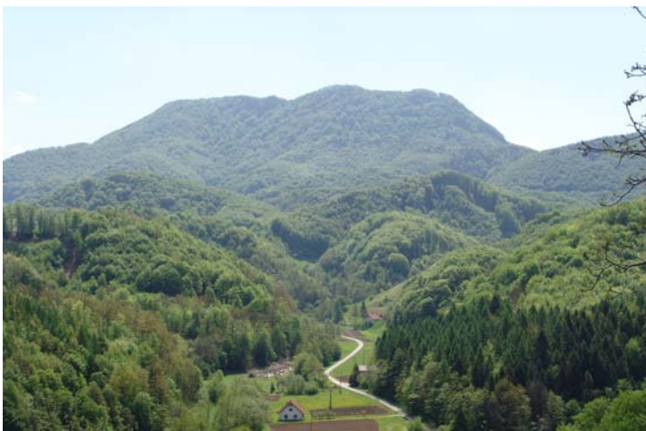
Slika 1: Pot proti Donački gori in Donačka gora

Od Rudijevega doma se lahko vzpnemo na vrh Donačke gore, sicer pa SPP vodi pod njo v družbi oznak evropske pešpoti E7 in Haloške planinske poti. Sledimo jim do označenega odcepa levo ter nadaljujemo skozi Završe in Kupčinja vrh – 5. KT. Nato se po cesti in po gozdnih vlakih vzpnemo pod vrh Jelovic, tam zapustimo Haloško planinsko pot in E7 ter pri kažipotu SPP zavijemo levo. Mimo gozdne kočice, kjer se nato spustimo po markirani poti navzdol do okrepčevalnice Dolina Winettu – zadnja 6. KT, kjer pa nam stalno v času od marca do novembra ponudijo slastne postrvi in še kaj.