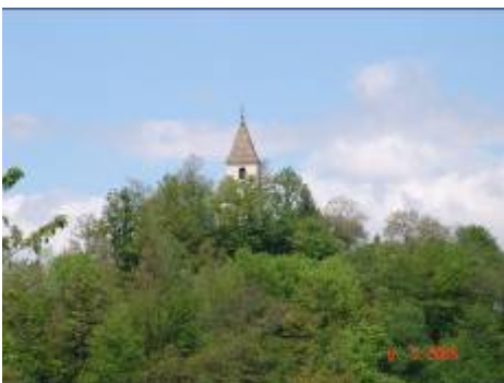
Slika 6: Sv. Ana z Ložnega

Cerkev sv. Ane je bila zgrajena okrog leta 1300, vendar je bila tolikokrat prezidana, da je od prvotne gotске stavbe ostal le prezbitერიj z gotskimi okni. Sv. Ana je zavetnica mater. K njej pa se zatekajo tudi ženske, ki bi želele imeti otroke. Zato v ta namen pred vhodom v cerkev na stropu visi vrv, privezana na zvon, ki bi jo naj ženske potegnile in si zaželele otrok. Tega božjega blagoslova je bilo v preteklosti v teh krajih kar precej.