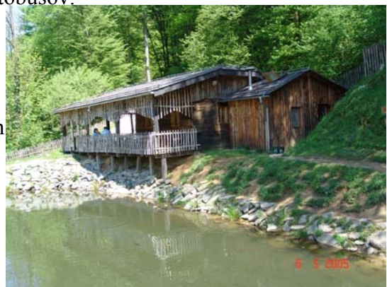
Slika 13: Dolina Winettu z ribnikom

Torej ste vsi ljubitelji narave, ribolova in kulinarčnih dobrot ste vabljeni v dolino Winettu.