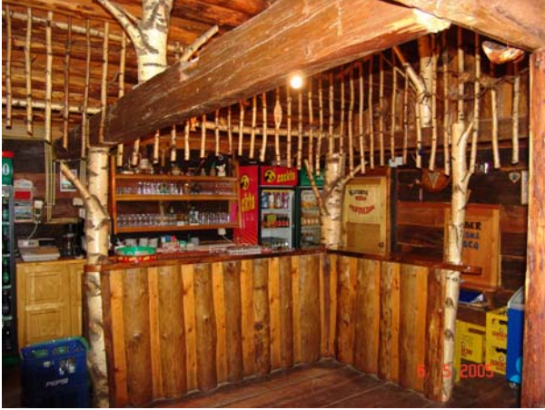
Slika 12: Notranjost okrepčevalnice Dolina Winettu

Torej po prehojenih grapah, hribih, dolinah, skratka po prehojeni Stoperški planinski poti, vam prav gotovo prija rahel počitek ob kakšni kavici, pivu, vinu in ob hrani. Pravzaprav ste potem na pravem cilju. Vse to vam nudijo v dolini Winettu – na zadnji kontrolni točki!