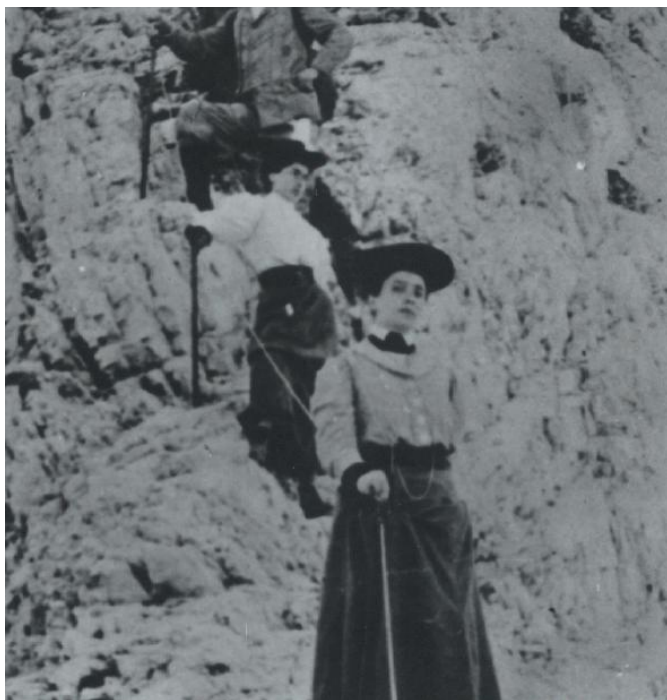
Sestop z vrha Triglava - leta 1907