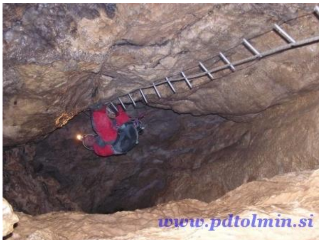
Mala Boka 2007