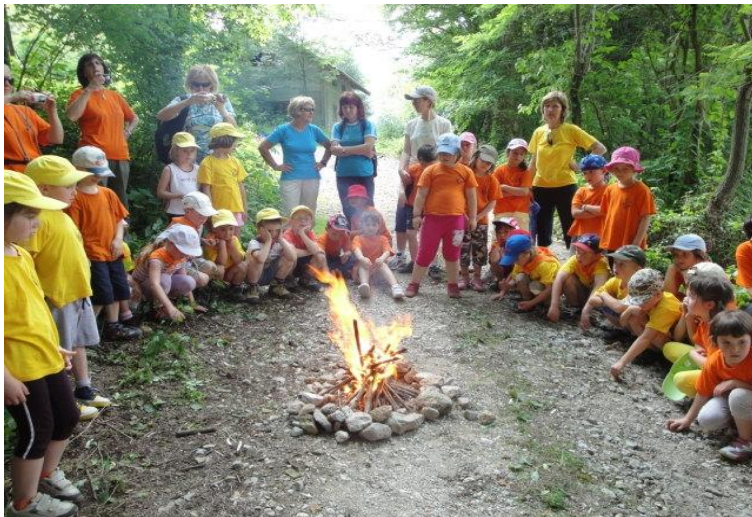
25. srečanje Cicibanov planincev 23.6.10

Prav članstvo v MO je močno vplivalo na članstvo v PDT. Saj so prav leta uspešnega delo MO tudi najštevilčnejša leta za PDT.