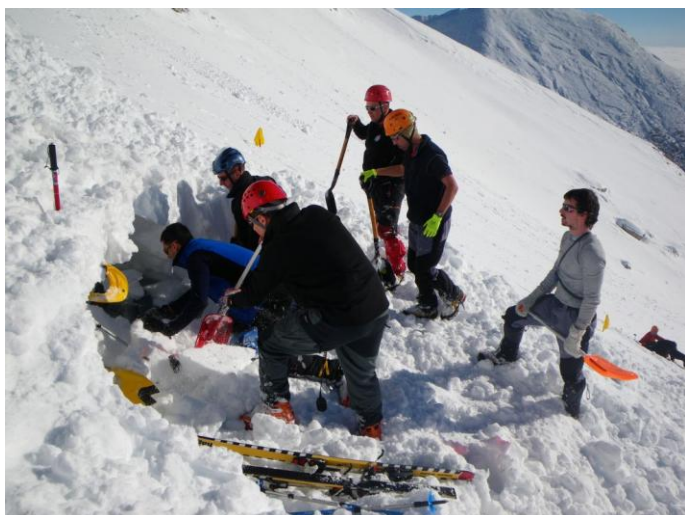
Vaja GRS, pl. Razor, 23.1. 2010

Danes šteje GRS 35 članov in 15 pripravnikov.