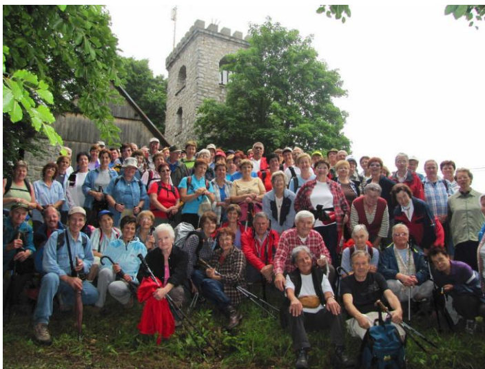
150 pohod upokoјencev, 19.6.2010

Pohodništvo oz. vodništvo predstavlja temeljno dejavnost planinskega društva. Vodniški odsek skuša približati gorski svet vsem tistim, ki se želijo v prijetni družbi drugih planincev podati v gore. Odsek združuje vodnike, usposobljene za vodenje skupin na izlete različnih težavnosti. Njegov vsakoletni cilj je na osnovi vnaprej načrtanega programa (cca 50 pohodov letno) izvesti varne in privlačne izlete v gore, predvsem za člane društva oziroma Planinske zveze Slovenije. Najbolj aktivni so upokoјenci, saj se posameznega pohoda udeleži med 80 in 100 planincev. Vodniški odsek Tolmin ima registriranih 15 vodnikov PZS.