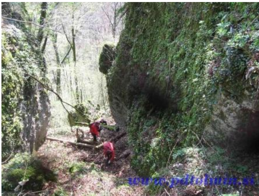
Akcija Očistimo Slovenijo 17.april 2010

Ustanovitev posameznih odsekov oz. sekcij gotovo vpliva na gibanje članstva v PD. Z ustanovitvijo posameznega odseka se doseže koncentracija isto usmerjenih, priključijo pa se tudi novi člani. Zasledili smo, da se ustanovitev posamezne sekcije na začetku mogoče jemlje preveč zlahka. Vsi odseki so namreč imeli takoj po ustanovitvi probleme s članstvom in obstojem. Po določenem prehodnem obdobju pa začne članstvo zopet naraščati, doseže vrh, nato pa se zadeve stabilizirajo ali pa začnejo celo upadati. Zasledimo proces valovanja. To valovanje je lepo vidno tudi pri PD Tolmin. Imamo dva močnejša vala članstva – v obdobju od leta 1970 do leta 1980 in obdobje od leta 1984 do leta 1993. Kljub temu, da se je članstvo v posameznih sekcijah po ustanovitvi dvigovalo pa na skupno članstvo to ne vpliva veliko, ker vse sekcije razen mladinske v najboljših letih skoraj ne dosežejo več kot 40 članov.